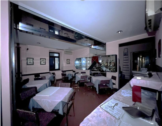
Foglio 39 part. 210 sub. 6