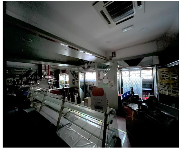
Foglio 39 part. 210 sub. 10