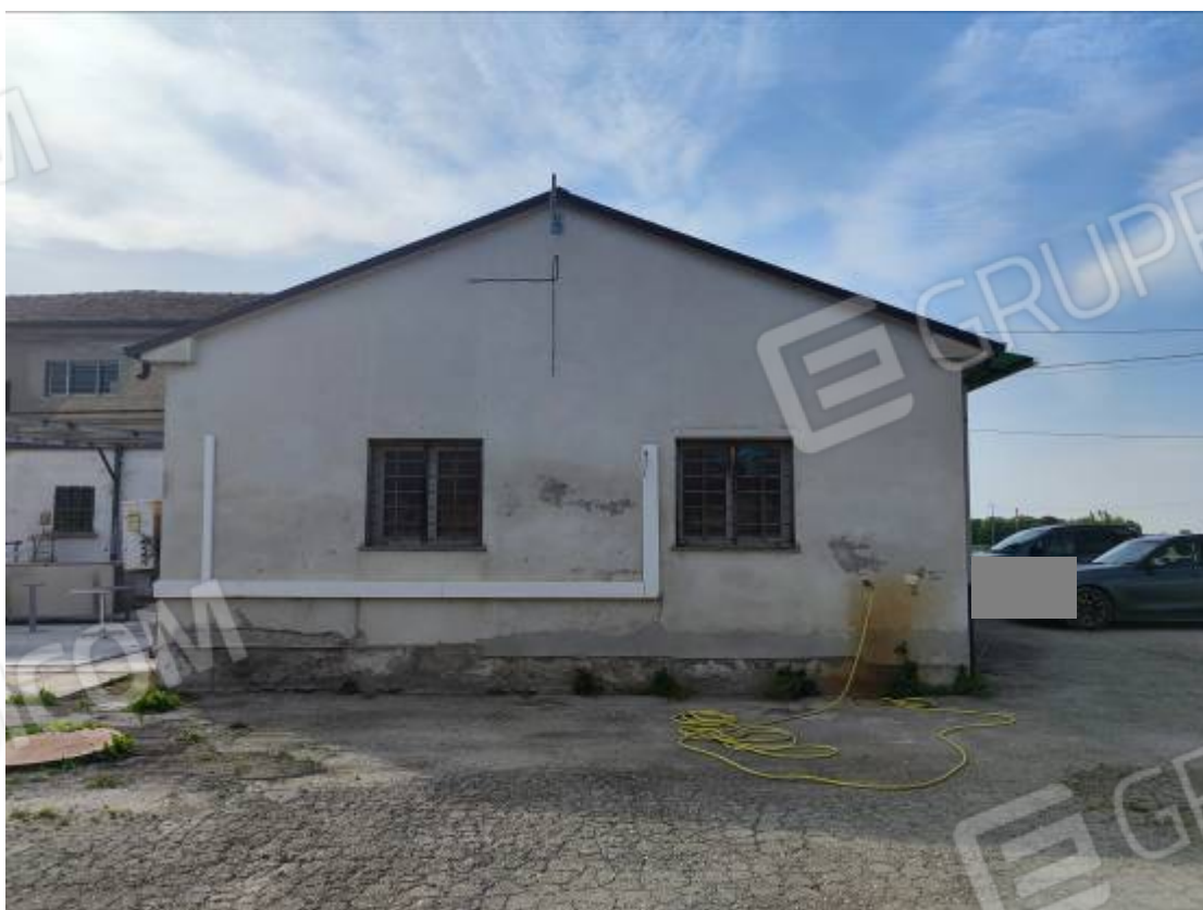
Vista del capannone 1, prospetto est della porzione più bassa dell'edificio