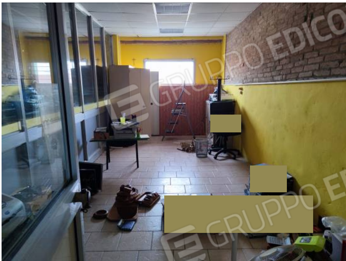
Vista di porzione di ripostiglio posto al piano primo