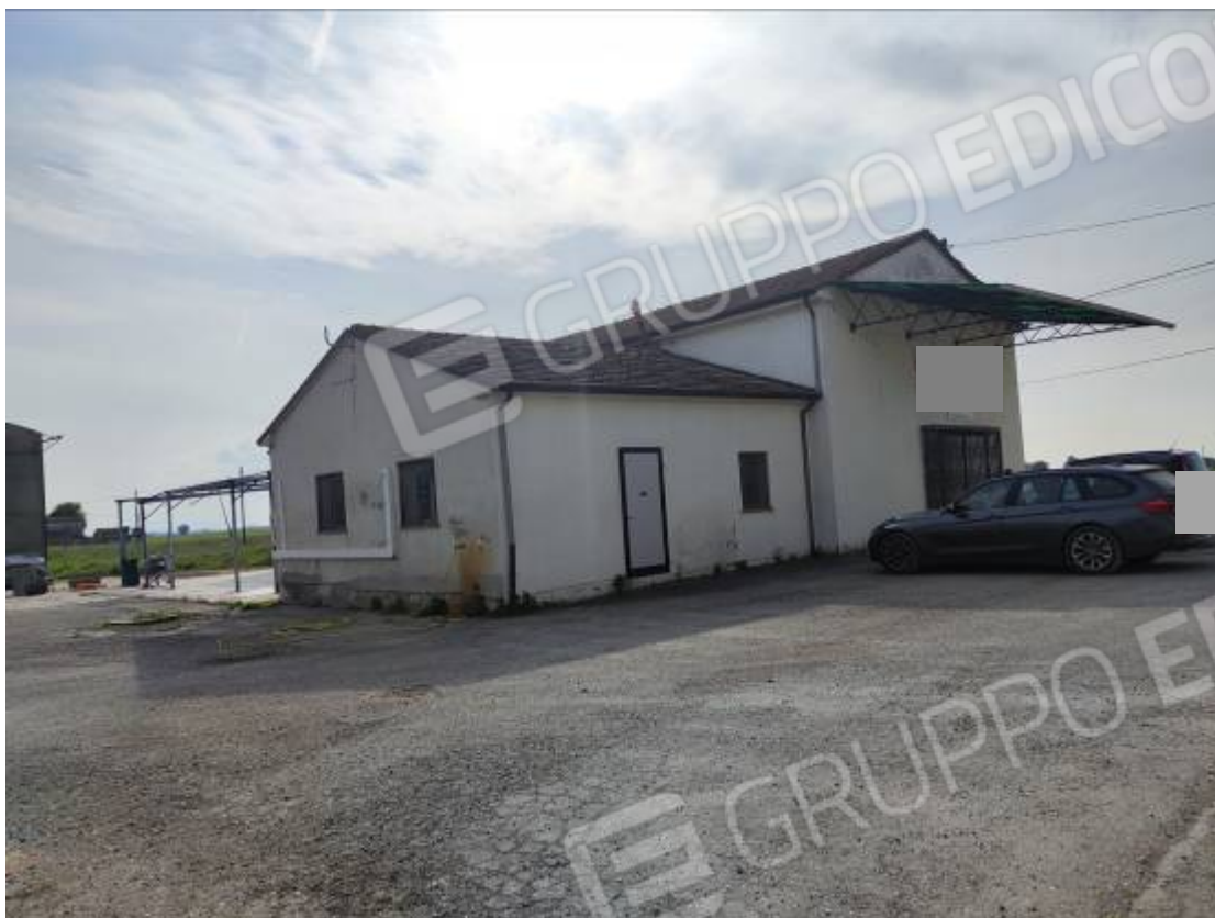
Vista del capannone 1, prospetto nord ed est