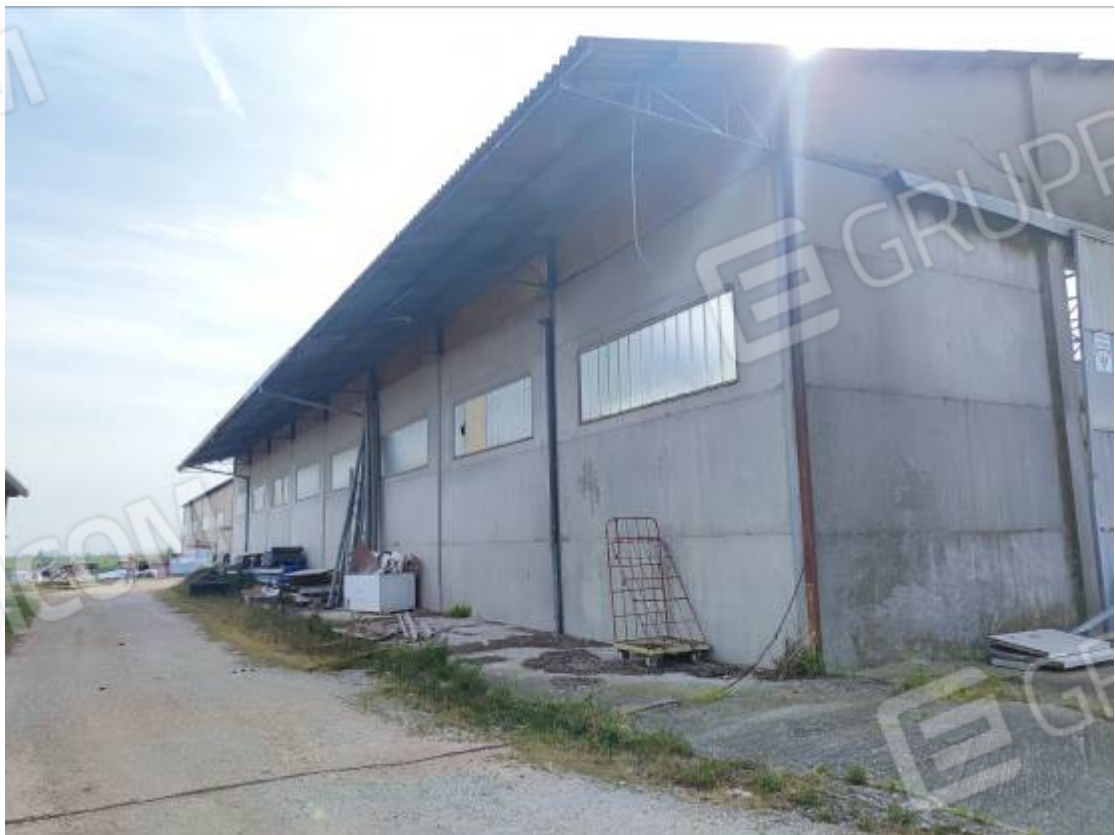
Vista del capannone 2, prospetto est