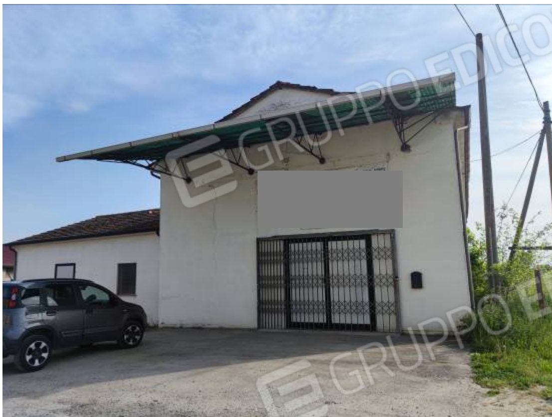
Vista del capannone 1, prospetto nord: vista dell'ingresso alla porzione più alta (zona mostra) e particolare della pensilina non regolare