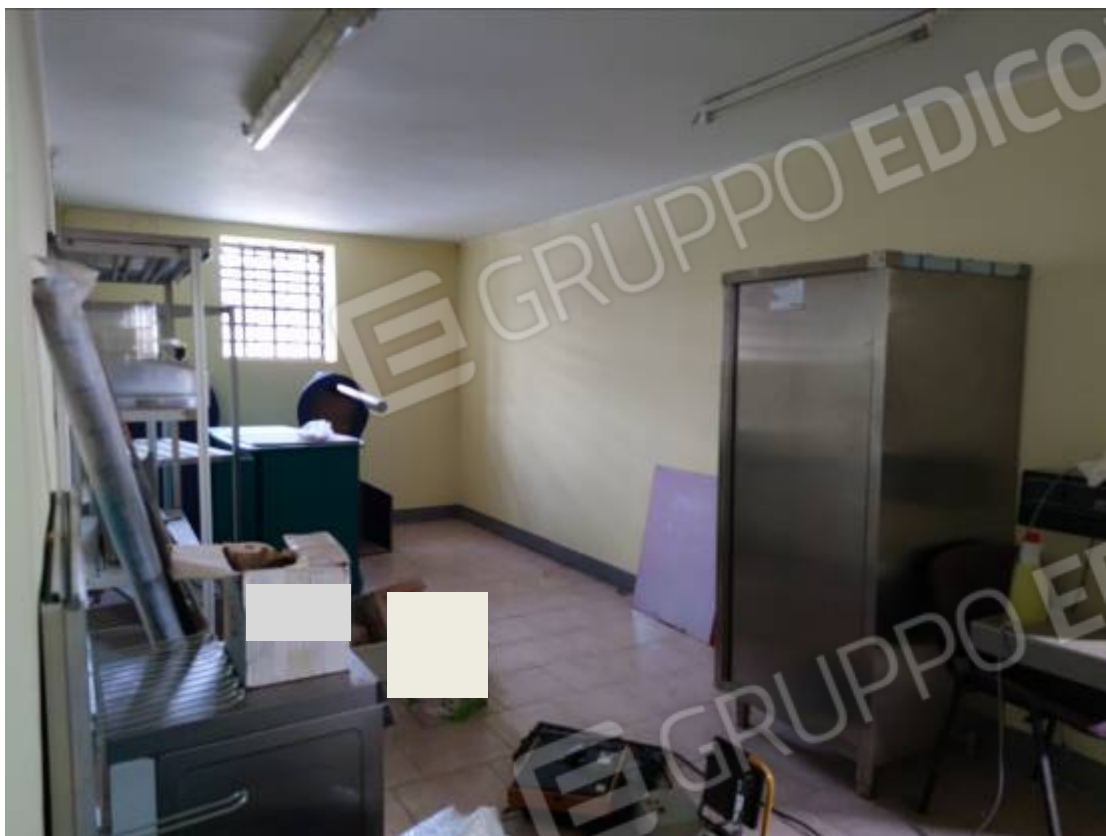
Vista del capannone 1, porzione della zona centrale adibita a deposito