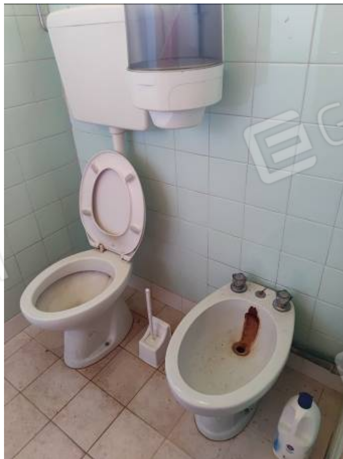
Vista del capannone 1, porzione del bagno