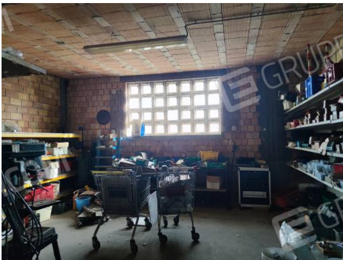
Vista del capannone 3, particolare di un'ambiente ad uso ripostiglio