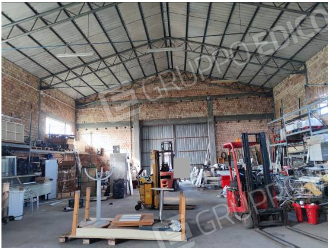
Vista del capannone 3, porzione dell'interno da sud verso la zona posta a nord