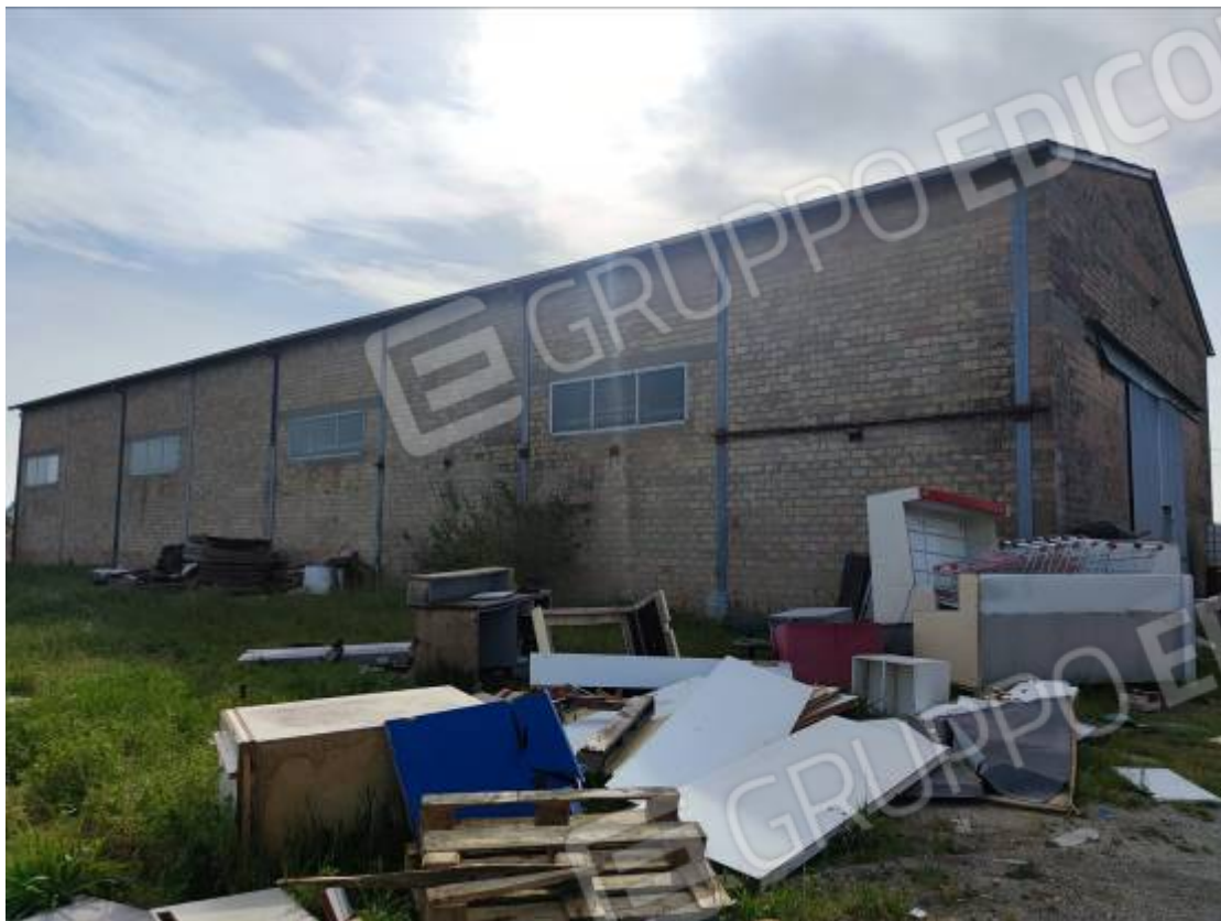
Vista del capannone 3, prospetto est