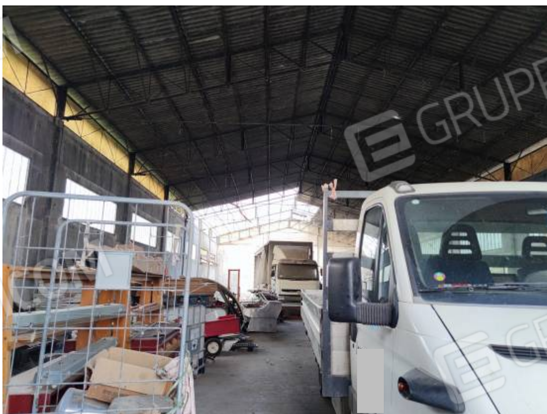
Vista del capannone 2, porzione dell' interno