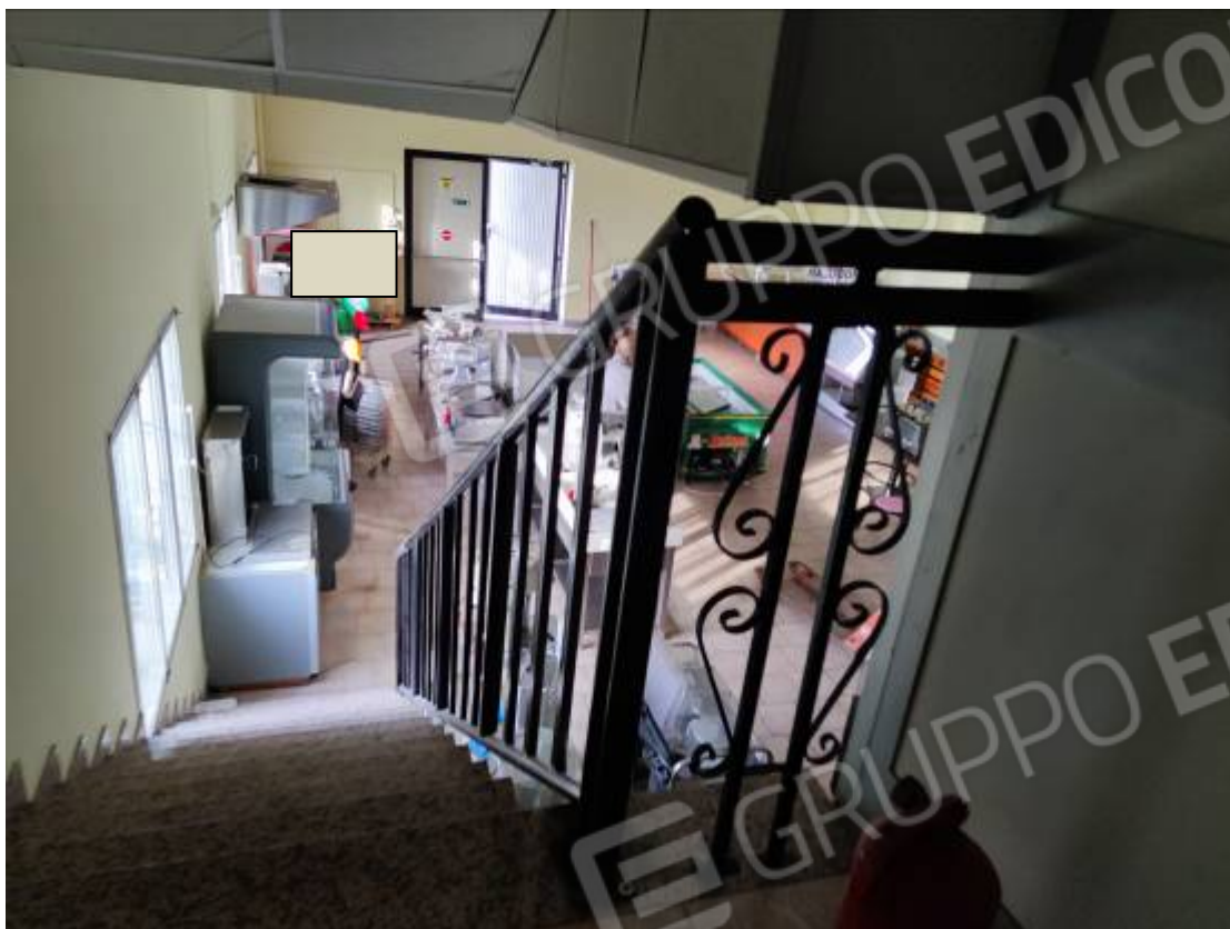
Vista dal piano primo delle scale interne