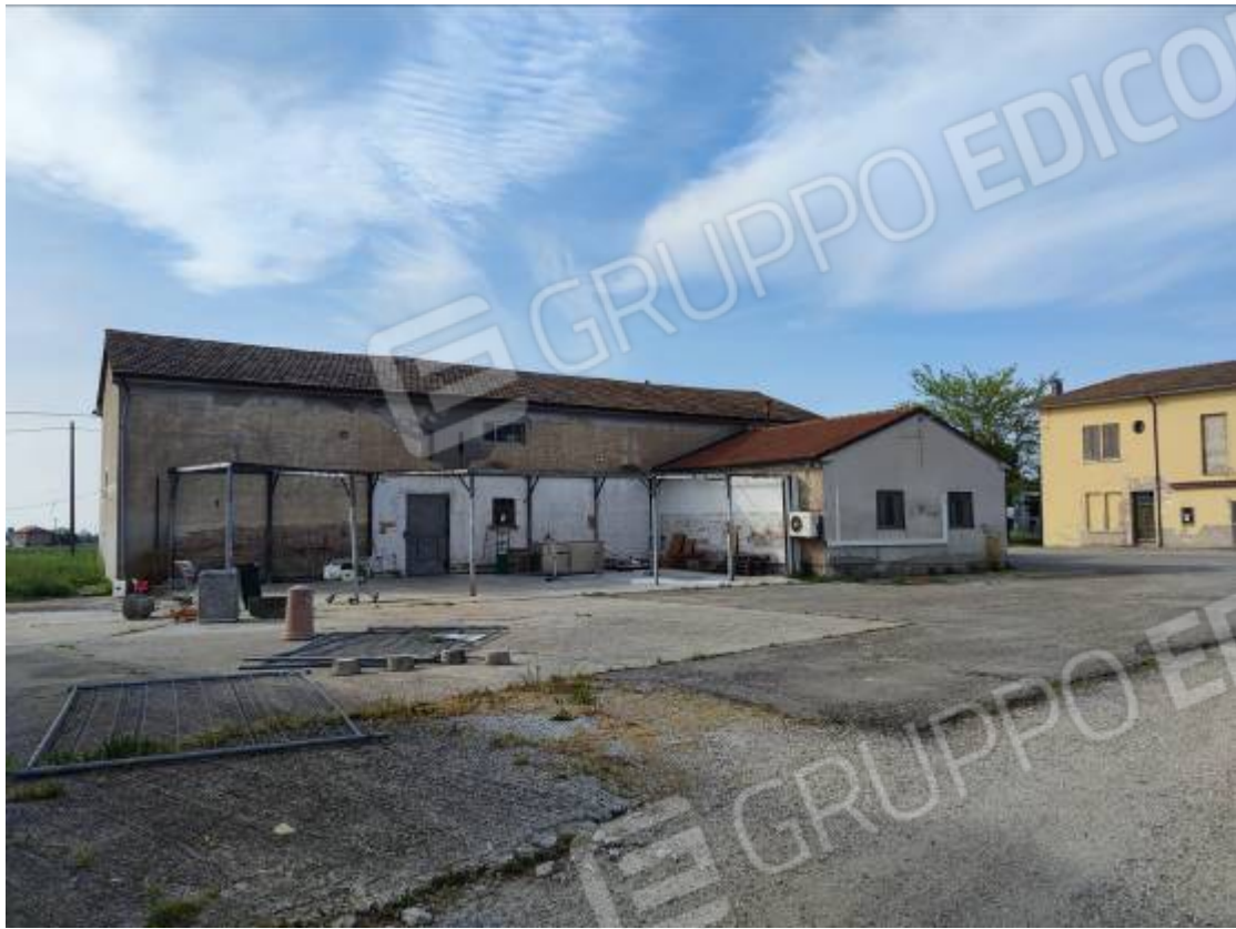
Vista del capannone 1 prospetto est