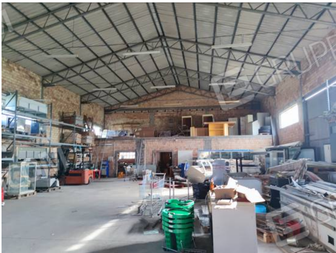
Vista del capannone 3, porzione dell'interno da nord verso la zona posta a sud