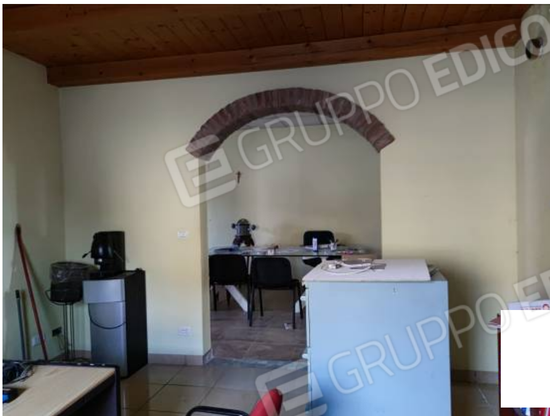
Vista, nel capannone 1, di porzione dell'edificio più basso adibito ad uffici e in particolare dell'apertura ad arco non autorizzata