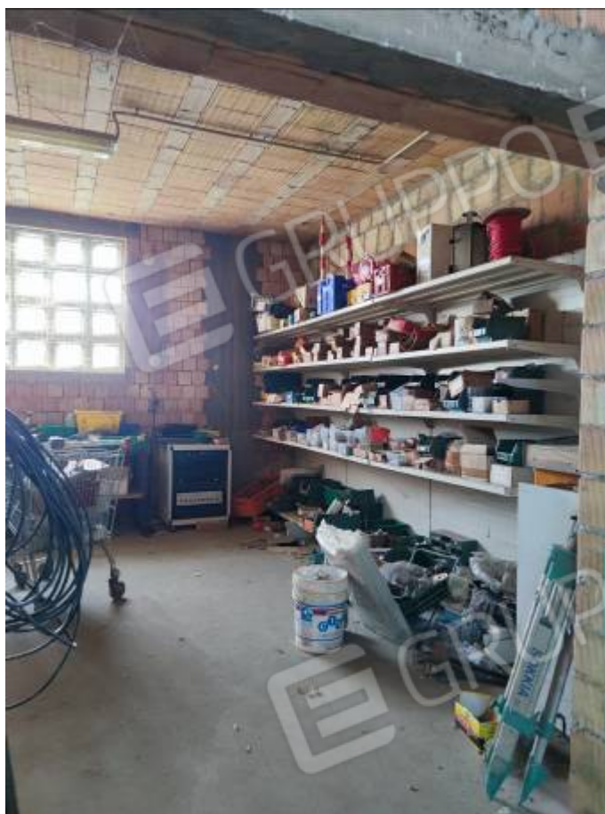
Vista del capannone 3, particolare di un ambiente ad uso ripostiglio