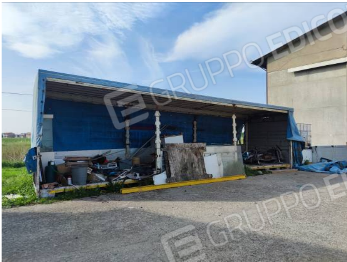
Vista dei depositi di materiali posti nell'area cortiliva