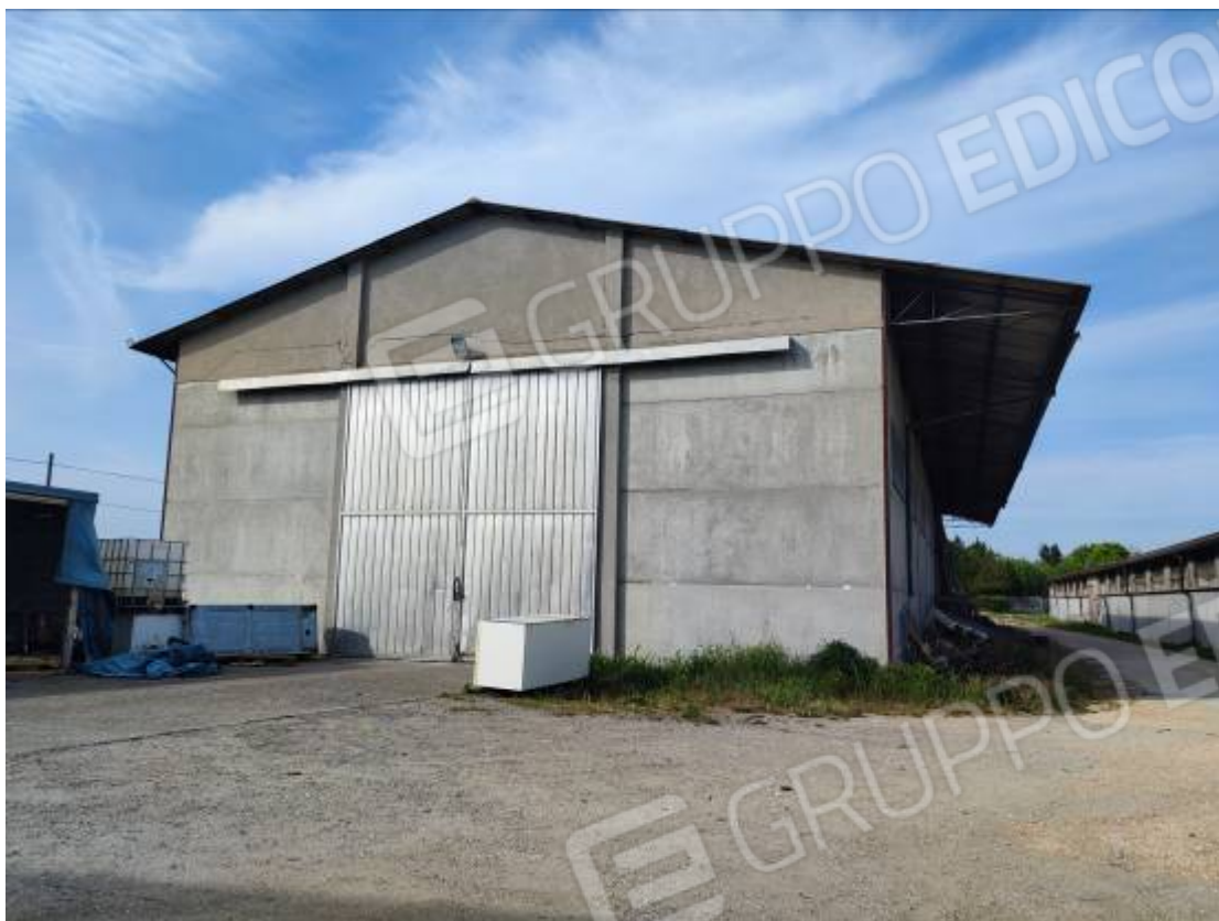
Vista del capannone 2, prospetto sud