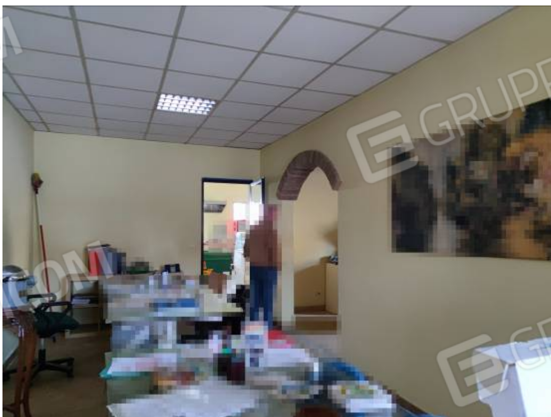
Vista, nel capannone 1, di porzione dell'edificio più basso adibito ad uffici ed in particolare delle aperture non autorizzate