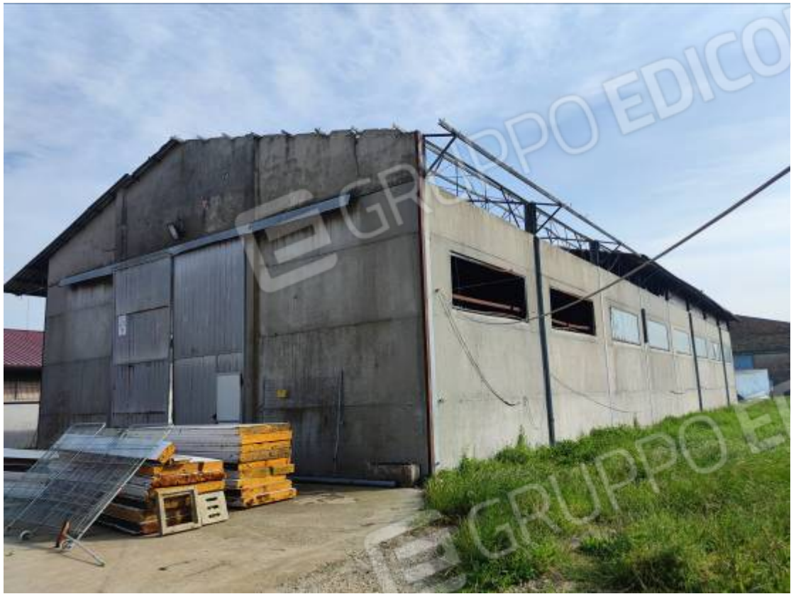
Vista del capannone 2, prospetto ovest