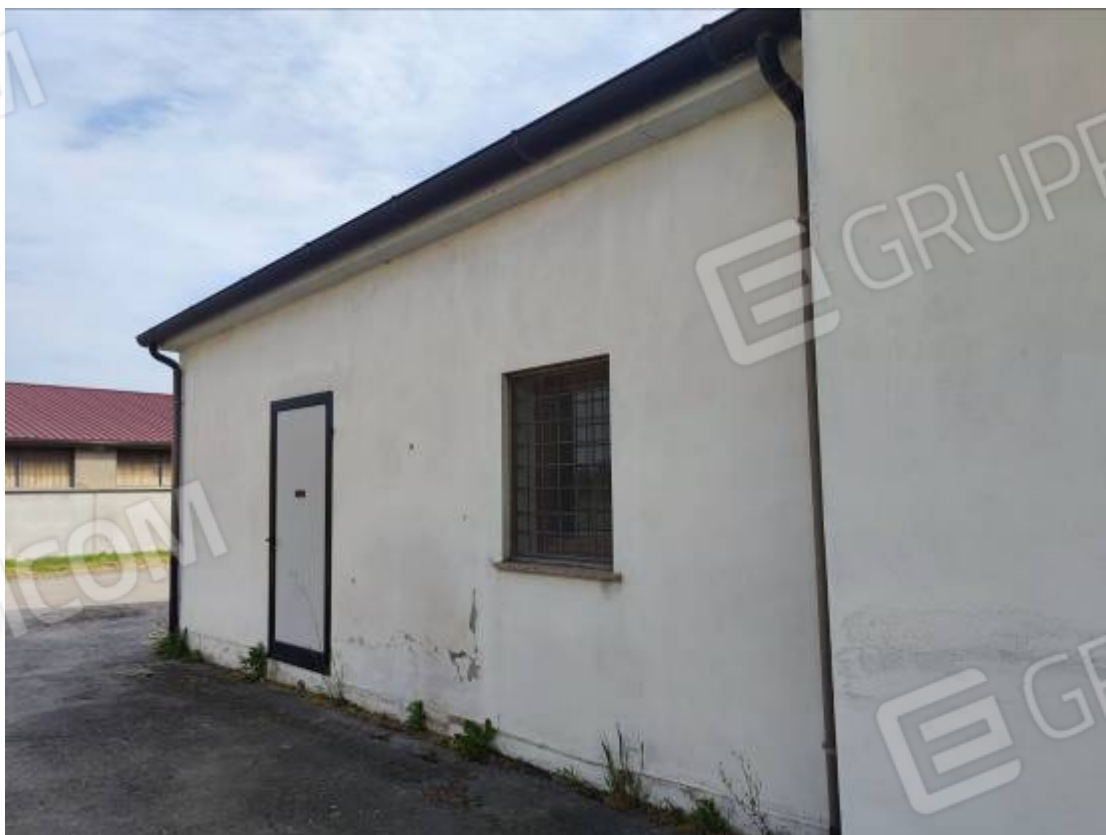
Vista del capannone 1, prospetto nord: porzione dell'edificio basso e particolare della porta non regolare di accesso al piccolo ambiente ricavato nella porzione più bassa dell'edificio