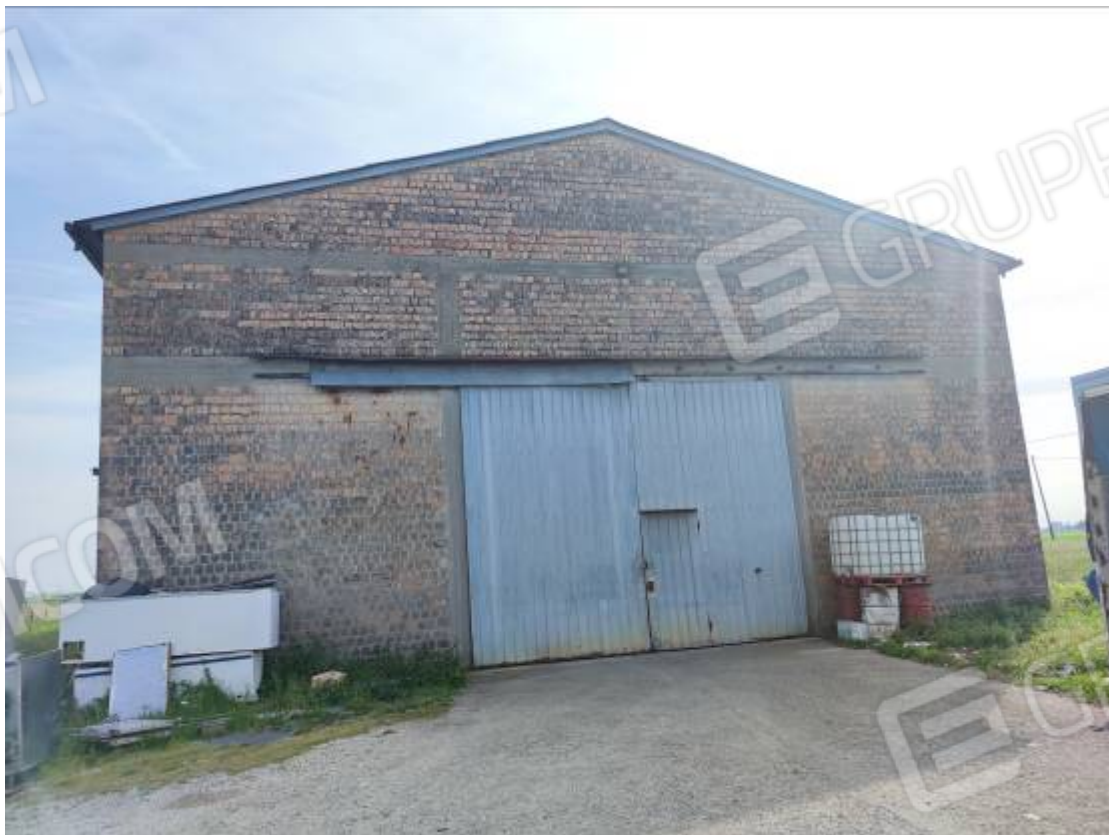
Vista del capannone 3, prospetto nord