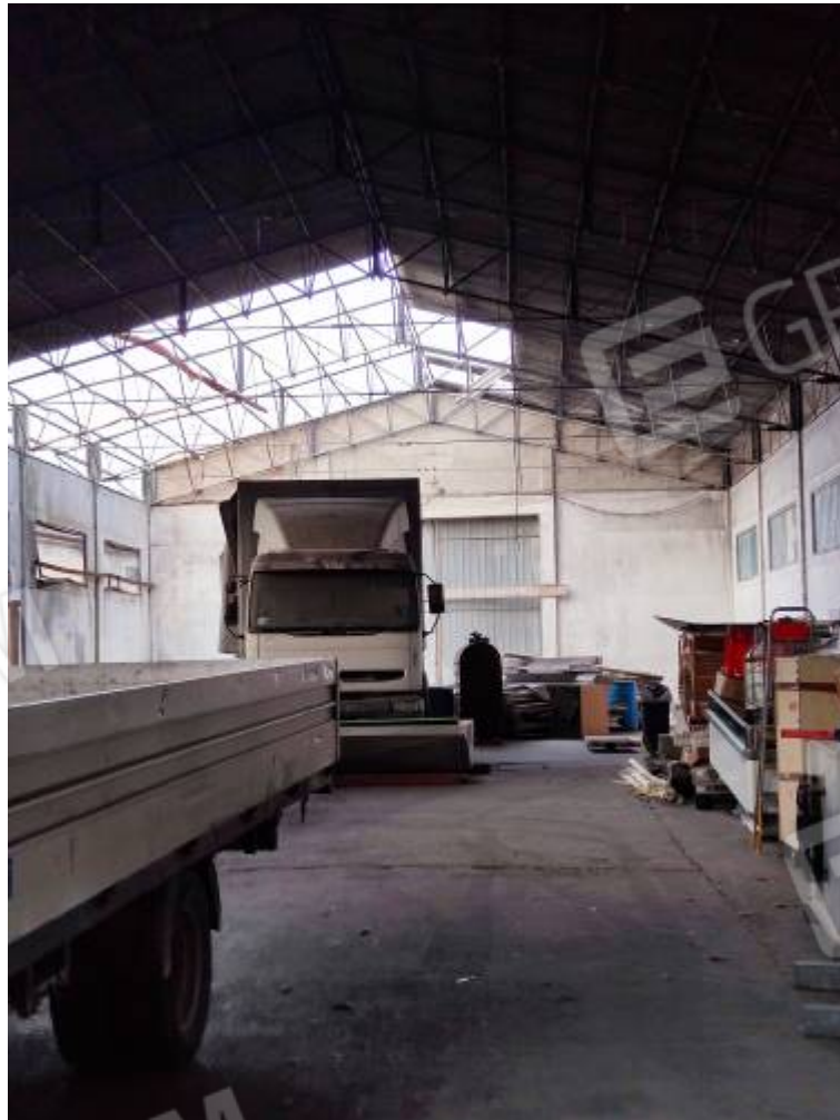
Vista del capannone 2, particolare dei danni causati dall'incendio del 2015