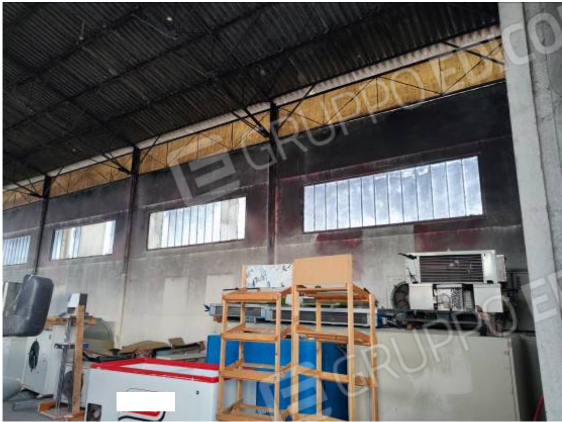
Vista del capannone 2, particolare dell' interno