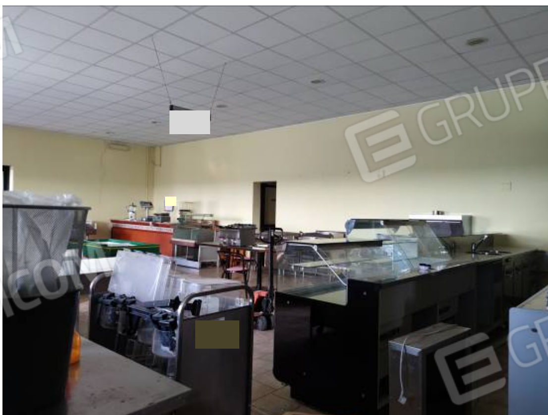
Vista del capannone 1, porzione della zona nord adibita a sala mostra