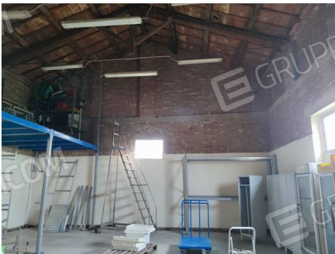
Vista del capannone 1, porzione della zona sud adibita a deposito