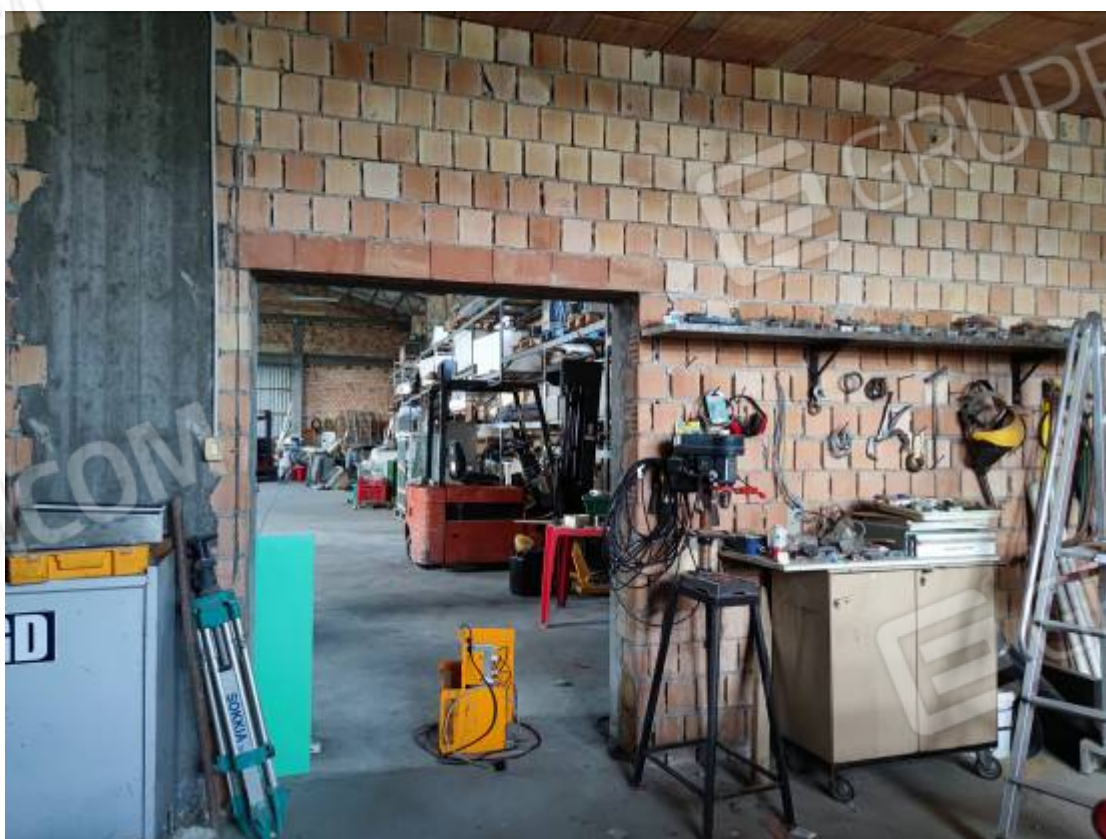
Vista del capannone 3, particolare di un ambiente ad uso ripostiglio verso la zona ad uso magazzino