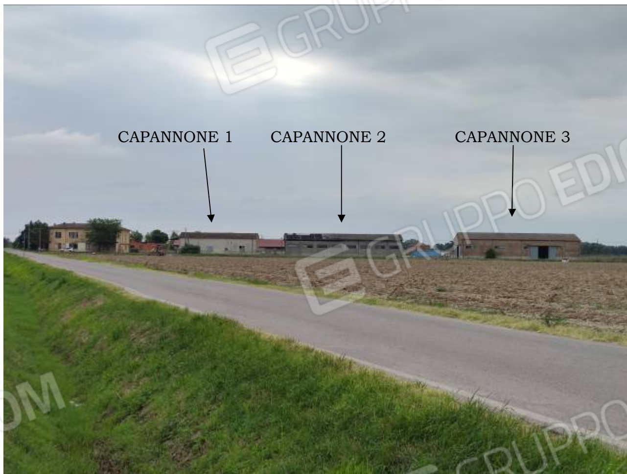
Vista degli immobili, posti parallelamente a via Lunga Inferiore, dalla via Stradone Bentivoglio in seguito all'alluvione del maggio 2023 (prospetti ovest)

Immobili in Lugo, loc. Voltana, via Lunga Inferiore n. 85