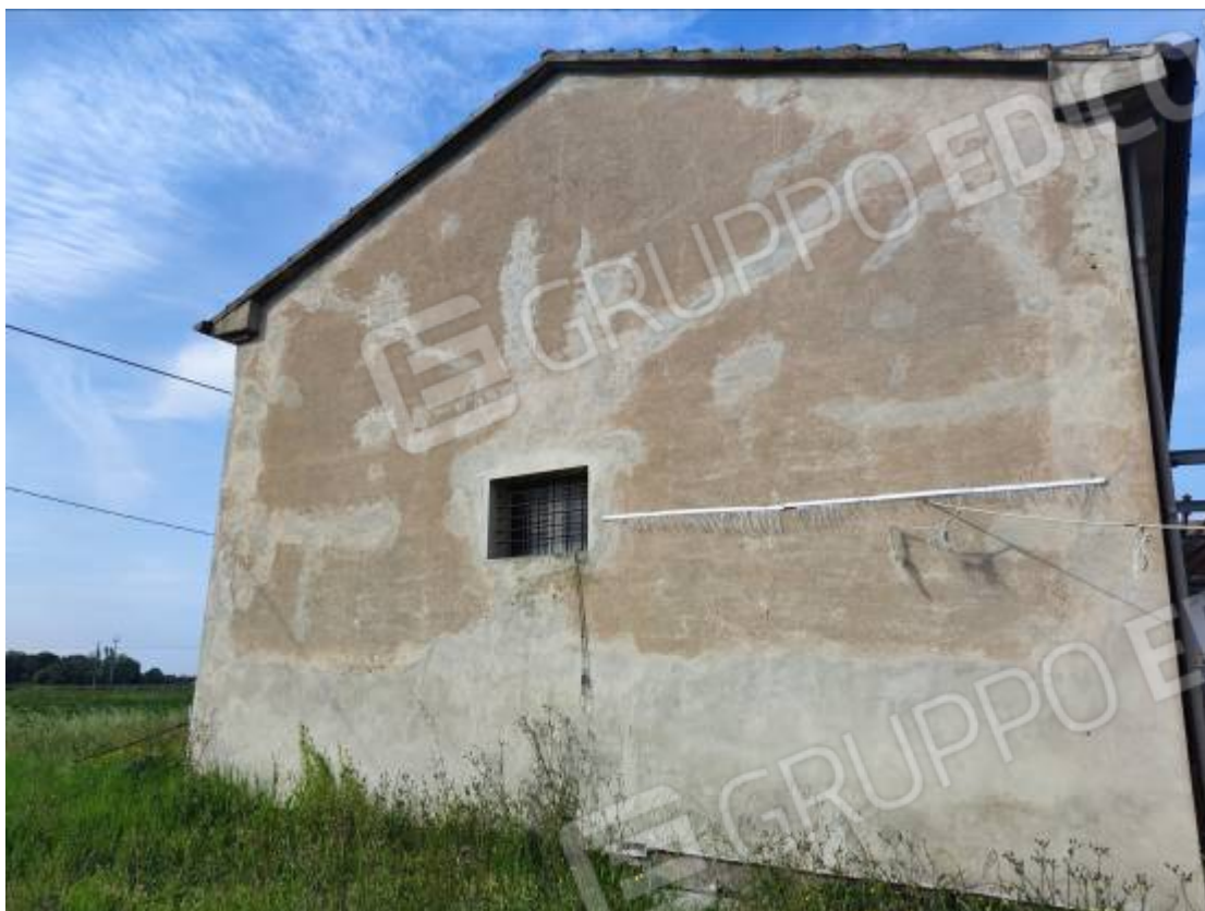
Vista del capannone 1 prospetto sud