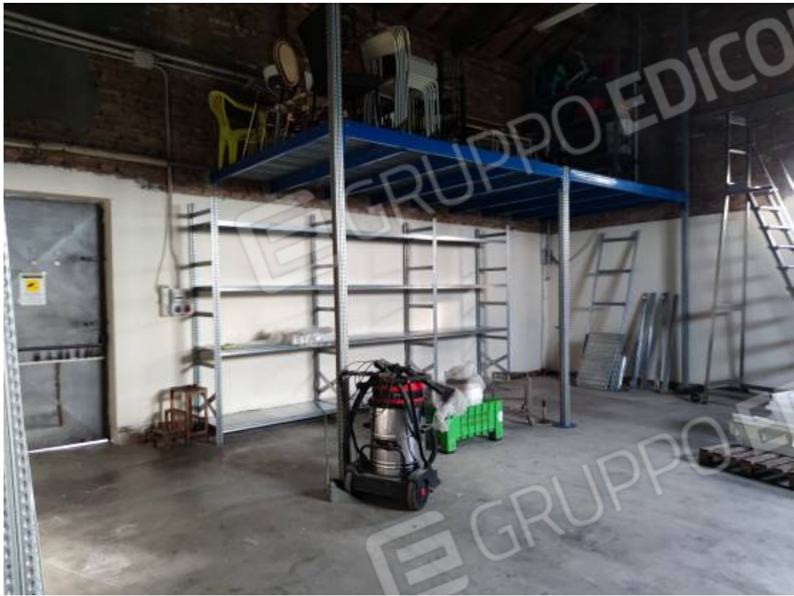
Vista del capannone 1, porzione della zona sud adibita a deposito e particolare del soppalco con struttura metallica