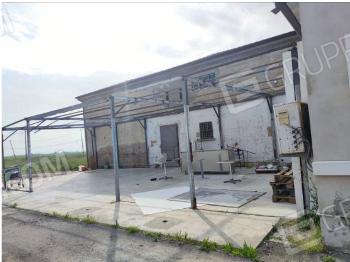
Vista di una porzione del prospetto est del capannone 1 e particolare dei resti della struttura di ampliamento non regolare e della relativa pavimentazione