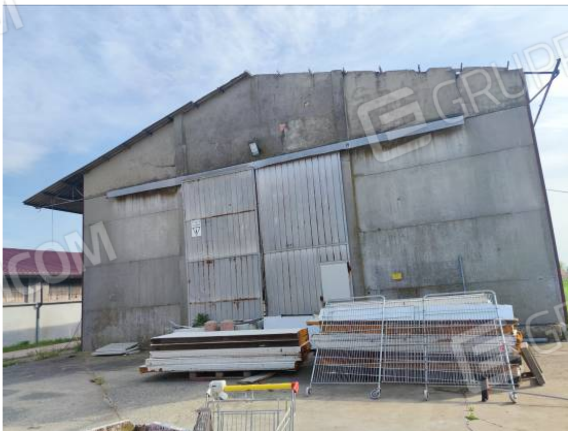
Vista del capannone 2, prospetto nord