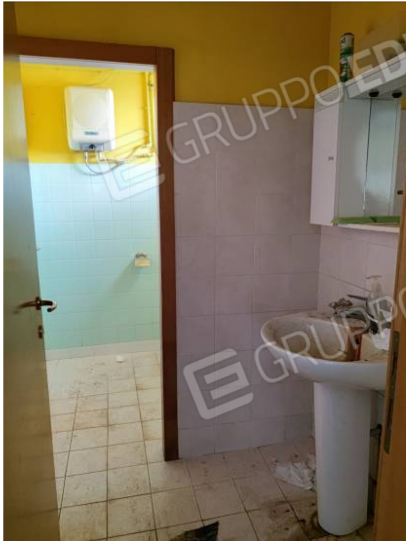
Vista del capannone 1, porzione dell' antibagno con in fondo vista di porzione del bagno