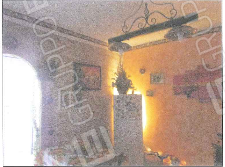
foto 12-13 - Tramite scala si accede al secondo piano composto da disimpegno servente il soggiorno-pranzo intonacato e ben rivestito. Dal soggiorno si accede alla cucina.