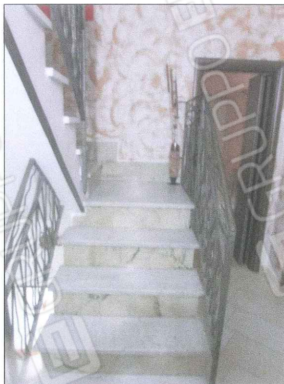
foto 8-9 - Foto della scala e del disimpegno del primo piano da cui si accede alle camere da letto e al wc. Le porte sono in legno scorrevole e di buona qualità.