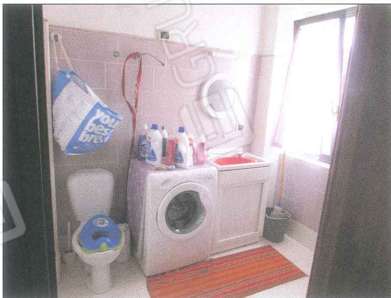
foto 16-17-18 - Foto del terzo piano costituito da un ambiente soggiorno, un wc e un terrazzino coperto con tettoia.