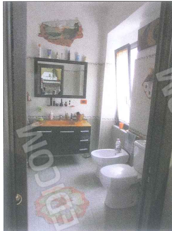
foto 14-15 - Foto della cucina e del wc del secondo piano rivestiti in ceramica. Gli infissi sono in alluminio.