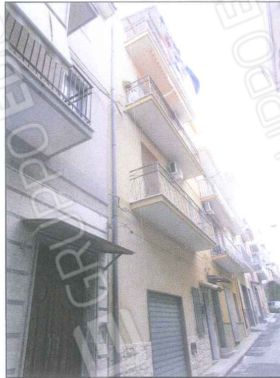
foto 4-5 - Foto dell'edificio prospiciente su via Isonzo, costituito da 4 piani fuori terra (con piano terra destinato a garage - bene 2). il bene 3 è composto da primo, secondo e terzo piano destinati ad abitazione. La facciata in muratura è rifinita ad intonaco e si trova in buono stato di conservazione.