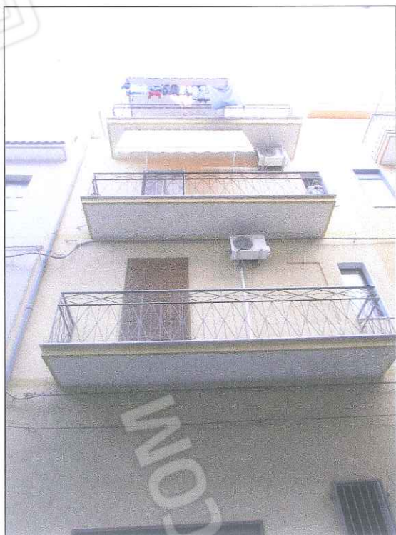
foto 6 - Il prospetto e i balconi sono stati ristrutturati di recente.

foto 4-5 - Foto dell'edificio prospiciente su via Isonzo, costituito da 4 piani fuori terra (con piano terra destinato a garage - bene 2). il bene 3 è composto da primo, secondo e terzo piano destinati ad abitazione. La facciata in muratura è rifinita ad intonaco e si trova in buono stato di conservazione.