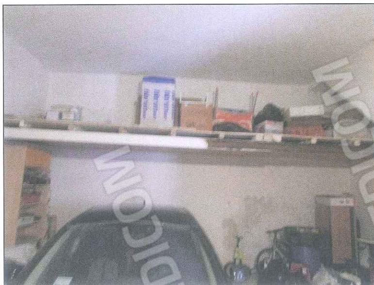
foto 2-3 - Foto dell'ambiente interno del garage pavimentato e intonacato. Sono presenti un wc e un soppalco. Lo stato conservativo è discreto.