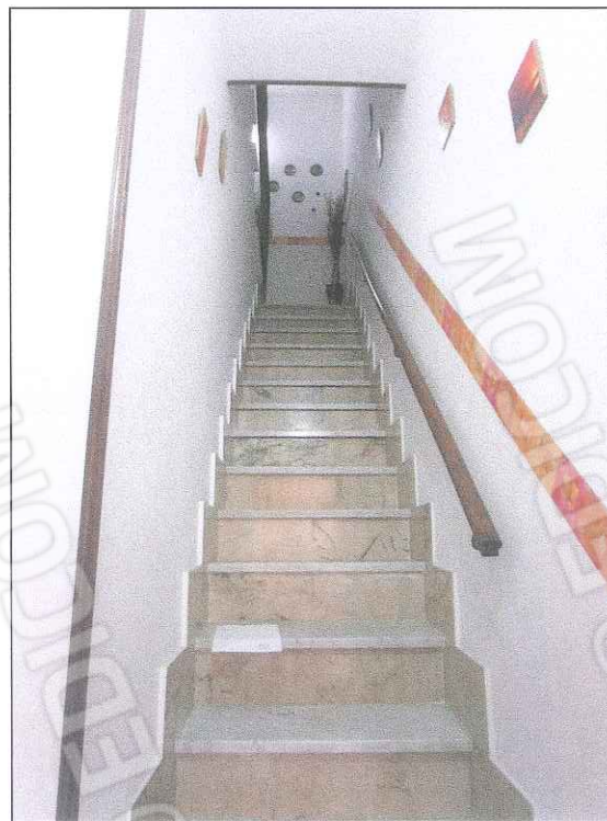
foto 7 - Foto dell'ingresso all'appartamento da via Isonzo n. 83 con scala rivestita in marmo conducente ai piani superiori.

foto 6 - Il prospetto e i balconi sono stati ristrutturati di recente.