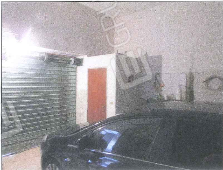
foto 1 - Foto del garage con accesso da via Isonzo n. 81. Il prospetto è intonacato, rifinito e si presenta in buono stato conservativo.