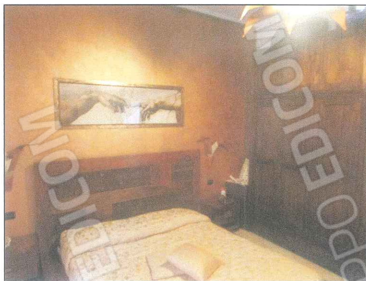
foto 10-11 - Foto della camera singola e matrimoniale. Gli ambienti sono intonacati ed in buono stato conservativo.