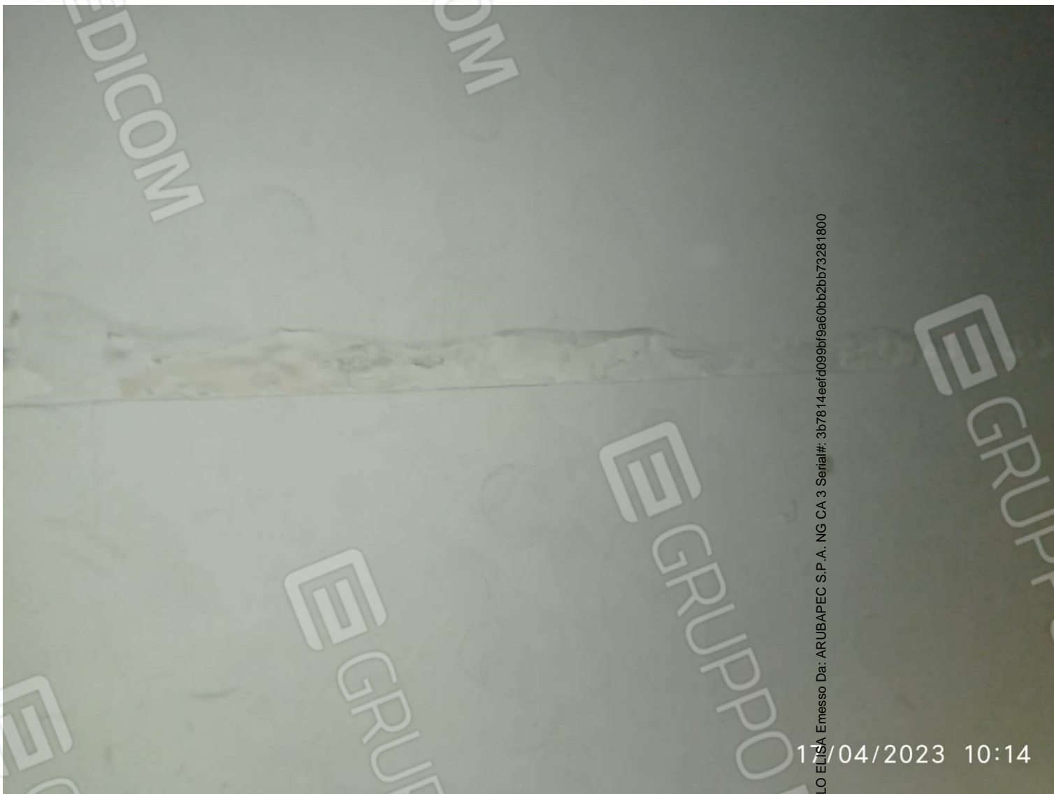
Foto 6 – Dettaglio effetto dell'umidità di risalita su pareti laterali del Lotto 1